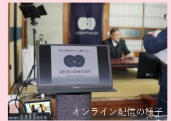
オンライン配信の様子